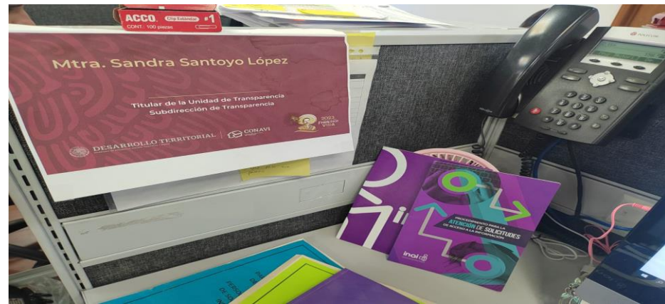
Ubicación de la Titular de la Unidad de Transparencia